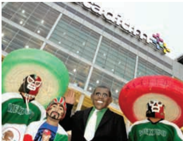
LA AFICIÓN mexicana se hizo presente en gran número, tal y como sucede cuando el Tricolor juega en tierras estadounidenses.

su novena victoria en 11 encuentros ante los venezolanos, que han tenido dos igualadas como mejor resultado ante los mexicanos.