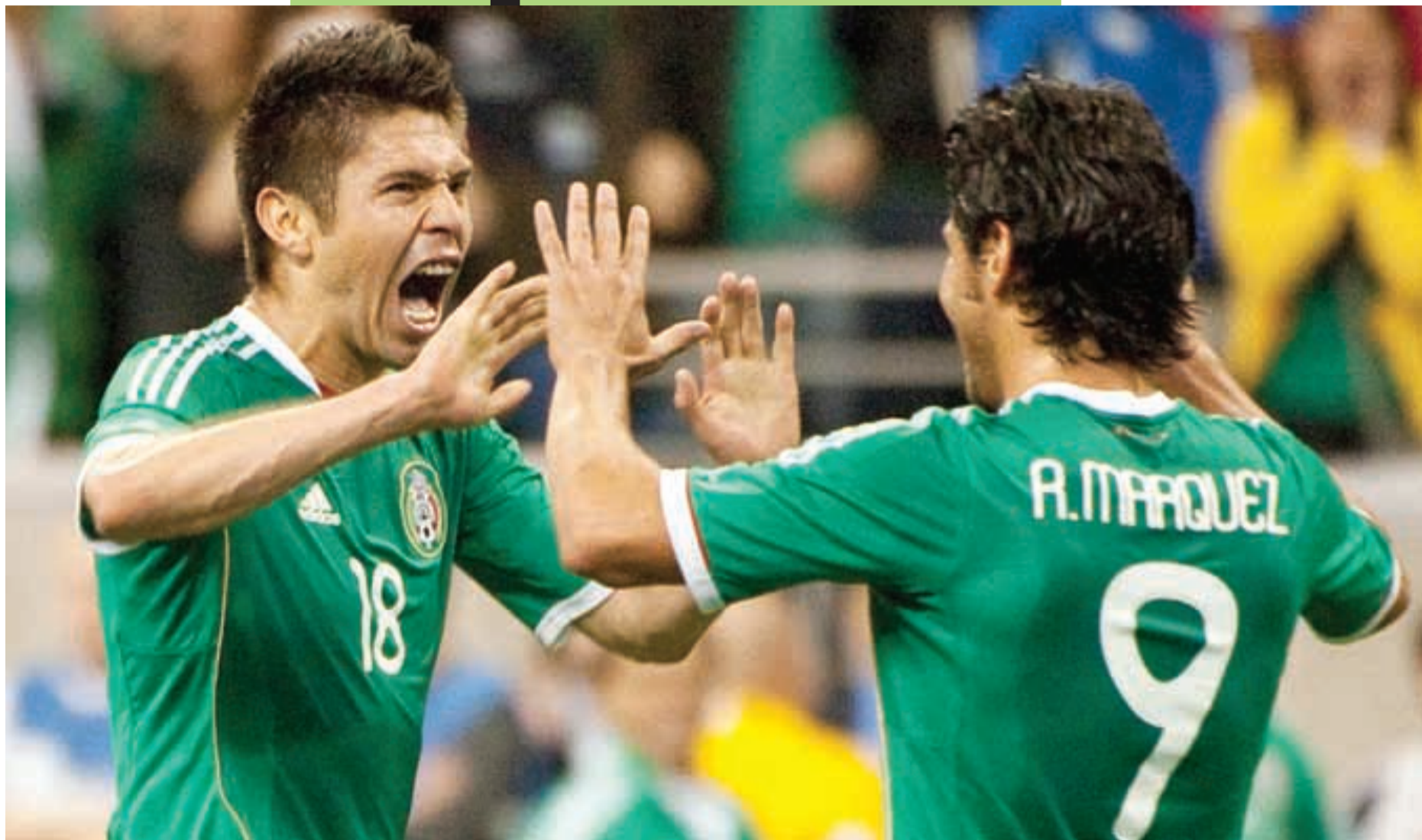
LOS JUGADORES mexicanos Oribe Peralta y Rafael Márquez Lugo festejan la tercera anotación del Tri sobre la escuadra venezolana.